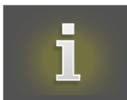
TABLEAU DES GAINS

Vue des règles du jeu et des prix à gagner pour les combinaisons de symboles gagnantes.